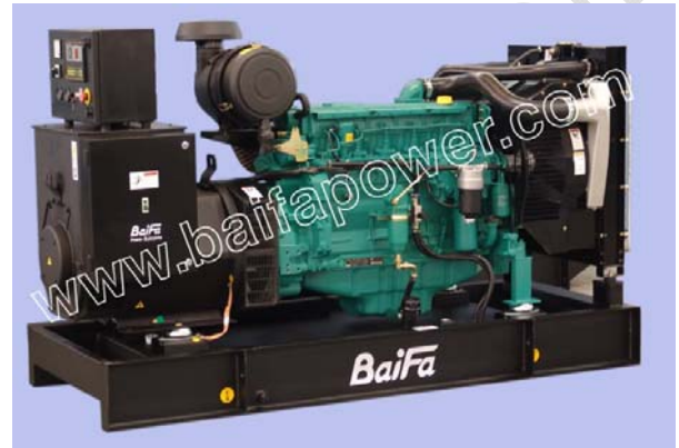
机组外形, 仅供参考