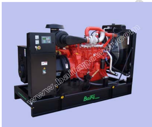
机组外形, 仅供参考