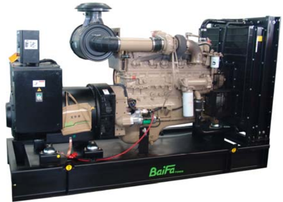
机组外形, 仅供参考